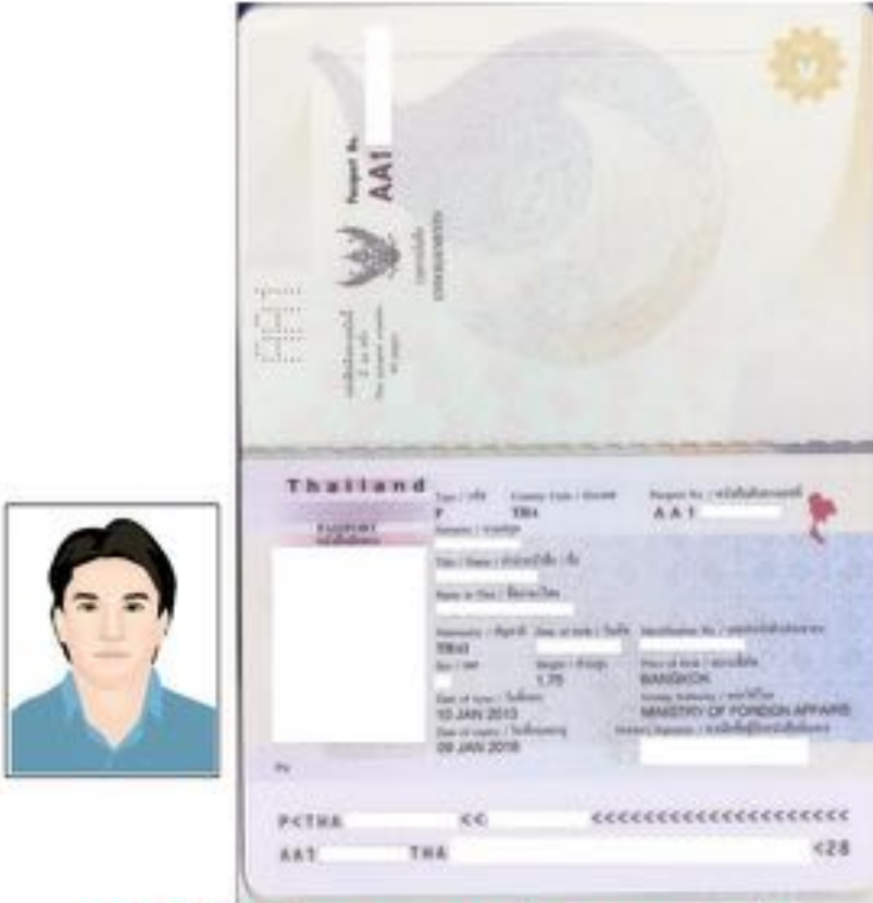
วางรูปถ่ายข้างๆPassport แล้ว สแกนพร้อมกัน

(ราคาใหม่ปรับใช้ตั้งแต่ 15 มีนาคม 62 เป็นต้นไป ประกาศจากสถานทูตจีน)