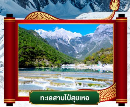
ทะเลสาบไป๋สฺยเหอ