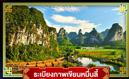
ระเบียงภาพเขียนหมื่นลี้