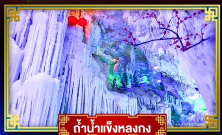
น้ำตกเจียงหลงกวง

"เที่ยว 2 มณฑล กวางซี-ก๊วยโจว" สุดอลังการ น้ำตก 2 พรหมแดน แหล่งท่องเที่ยวระดับ 5A