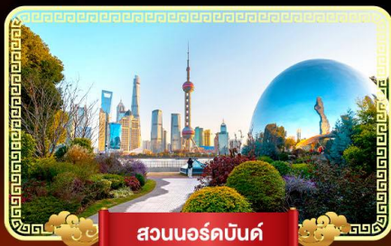
สวนนอร์คบินด์