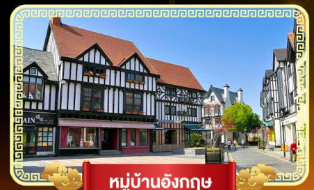
หมู่บ้านอังกฤษ