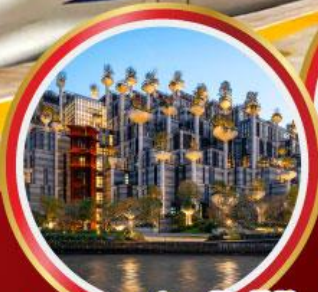
อาคารพินตันไม้