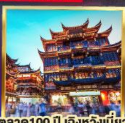
ตลาด 100 ปี เติ้งหวงเมี่ยว