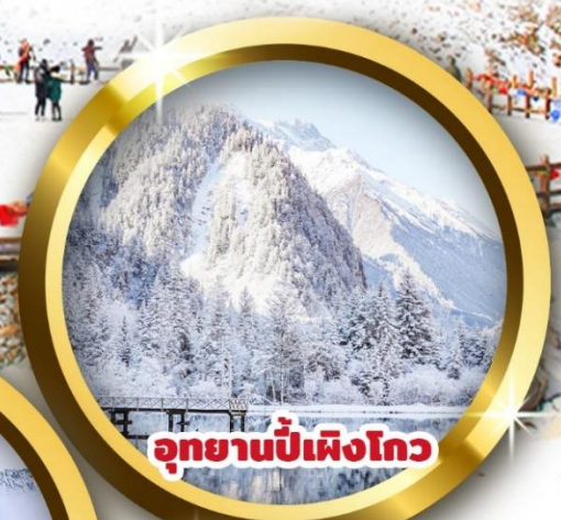
อุทยานปี้เฟิงโกว