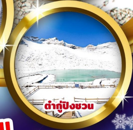
ตำกู่ปิงชวอน