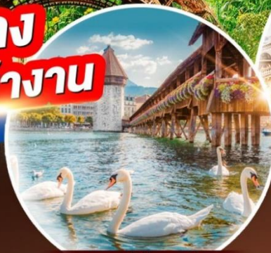
สะพานไม้ ซาเปา