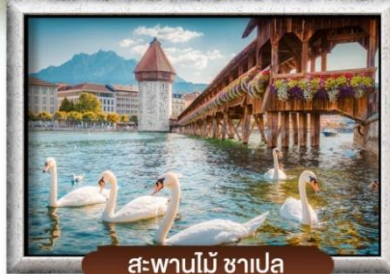
สะพานไม้ ชาเปล

✓ นั่งกระเช้า Eiger Express สู่ยอดเขาจุงfrau