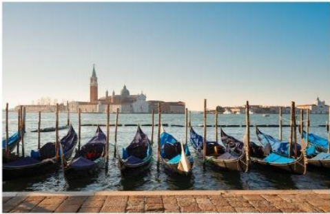
เรือกอนโดลา

นำท่านออกเดินทางสู่ ท่าเรือตรอนเคโต เพื่อเตรียมตัวนั่งเรือข้ามสู่เกาะเวนิส เกาะเวนิสเป็นดินแดนแสนโรแมนติก เป็นเมืองที่ไม่เหมือนใคร โดยใช้เรือแทนรถ ใช้คลองแทนถนน มีสมญานามว่าเป็น “ราชินีแห่งทะเลเอเดรียติก” มีเกาะน้อยใหญ่กว่า 118 เกาะและมีสะพานเชื่อมถึงกัน กว่า 400 แห่ง