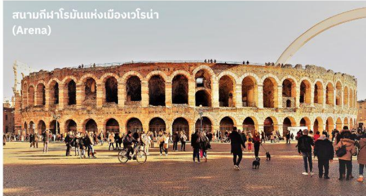
สนามกีฬาโรมันแห่งเมืองเวโรนา (Arena)