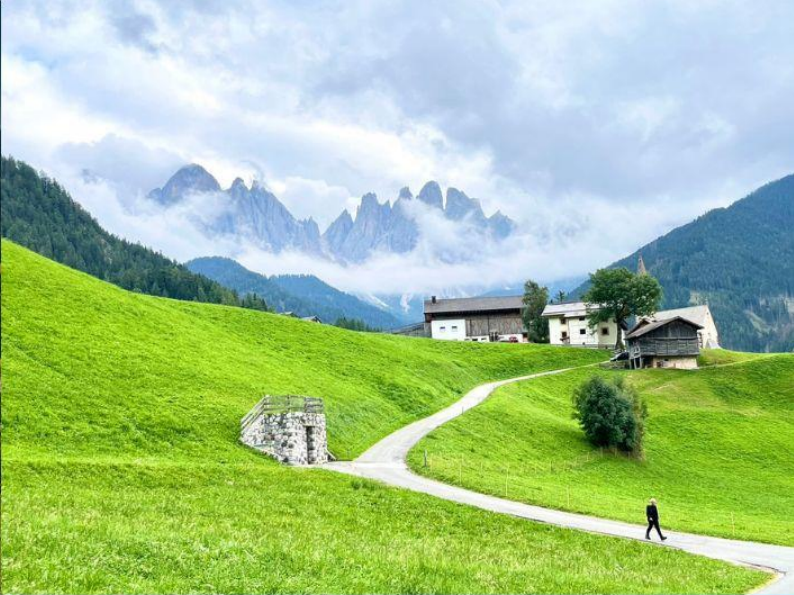
Santa Maddalena - Val di Funes