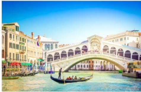
สะพานริอัลโต