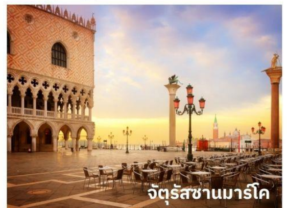
จัตุรัสซานมาร์โค

ท่านสามารถทำการสแกน QR CODE นี้ เพื่อรับชม เกาะเวนิส ในรูปแบบวิดีโอ