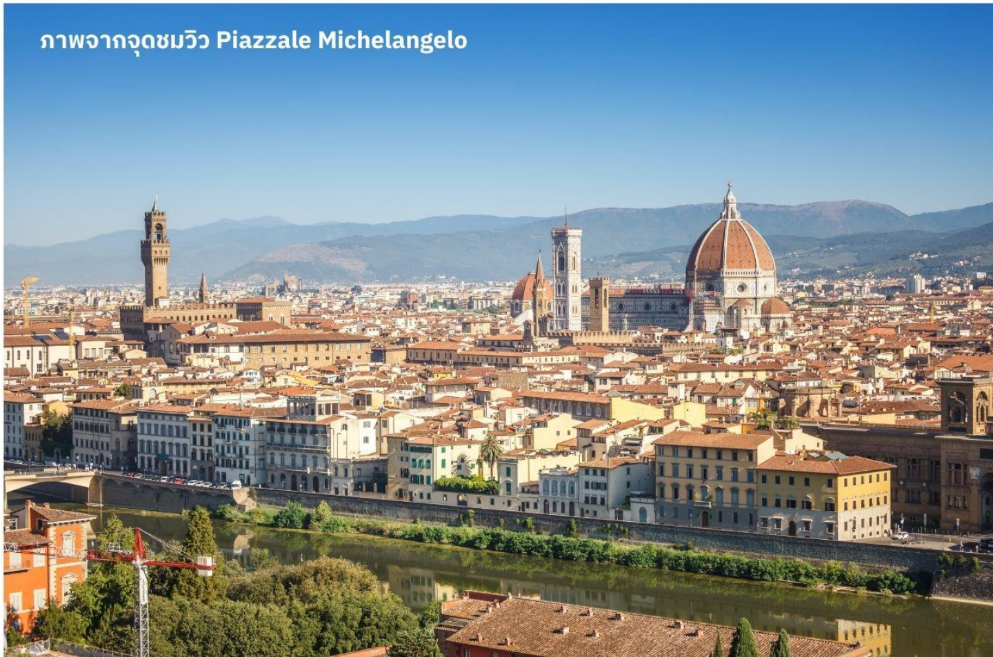
ภาพจากจุดชมวิว Piazzale Michelangelo

เมืองฟลอเรนซ์ ตั้งอยู่ทางตอนเหนือของประเทศอิตาลี เป็นเมืองที่มีชื่อเสียงในช่วงศตวรรษที่ 13-14 ซึ่งเป็นยุคที่เจริญรุ่งเรืองของวัฒนธรรมและศิลปะ อีกทั้งในอดีตยังมีความสำคัญทางการค้าและวัฒนธรรม มีสถาปัตยกรรมทั้งงดงามและเป็นที่มาของศิลปะโรแมนติกที่เจริญรุ่งเรืองอย่างมากในยุคนั้น นำท่านเดินทางไปยังเนินเขา Piazzale Michelangelo เพื่อชมวิวของเมือง Florence ที่นักท่องเที่ยวรวมไปถึงชาว Florence เอง มักขึ้นมาชมบรรยากาศในมุมสูงของเมือง ซึ่งจะเห็นหลังคาสีแดงของอาคารบ้านเรือนต่างๆ รวมไปถึง Duomo เรียงรายกันเป็นแนวสวยงามยิ่งนัก อีสาระให้ท่านเก็บภาพประทับใจตามอัธยาศัย