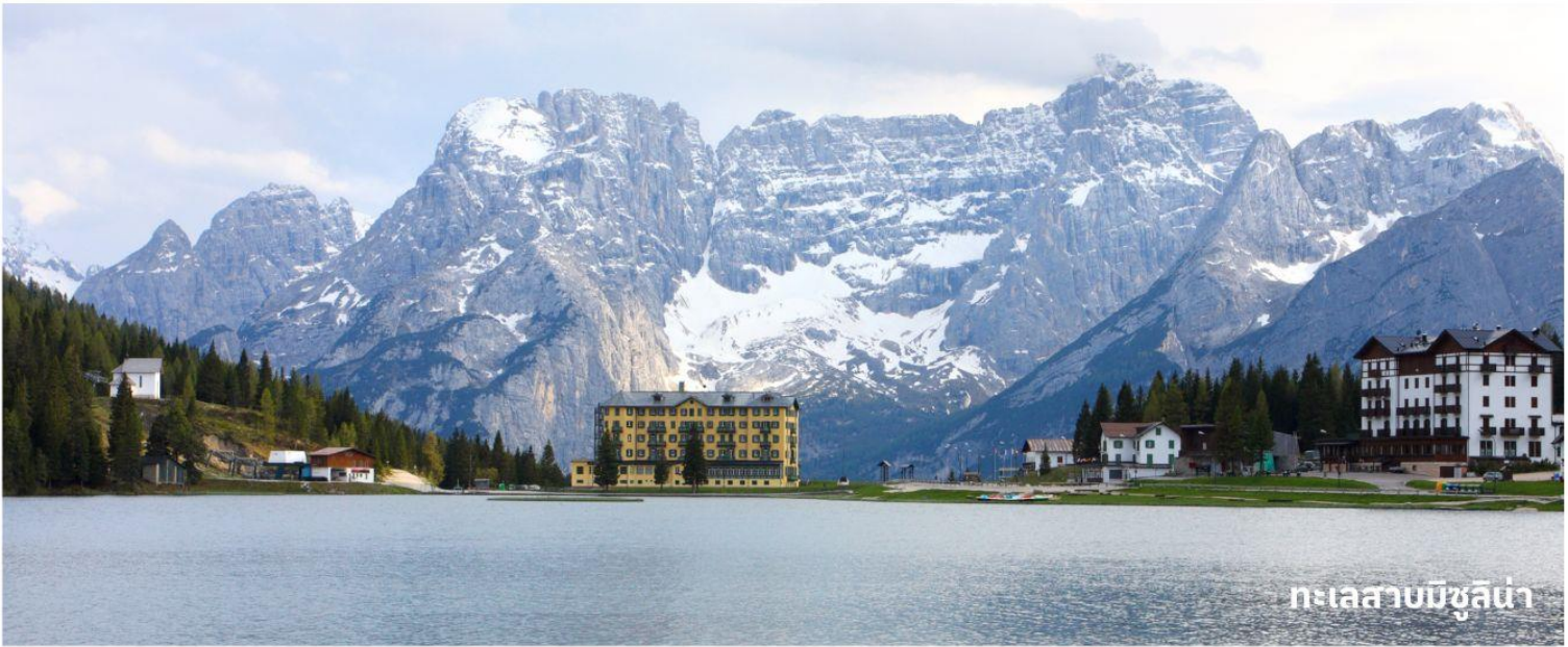
ทะเลสาบมิซูลิน่า

นำท่านเดินทางสู่ที่ ทะเลสาบมิซูลิน่า (MISURINA LAKE) ถ่ายรูปกับทะเลสาบที่สวยงามและเป็นเหมือนกับหนึ่งในแลนด์มาร์คที่นักท่องเที่ยวต้องมาเยือนสักครั้งหนึ่ง เป็นทะเลสาบที่หลบซ่อนตัวในหุบเขา ที่ถือเป็นสถานที่ท่องเที่ยวที่สำคัญอีกแห่งในโดโลไมท์