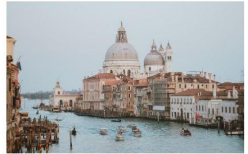
แกรนด์คาแนล

นำทุกท่านนั่งเรือต่อเพื่อไปยัง ท่าเรือซานมาร์โค (San Marco Pier) บนเกาะเวนิส แวะให้ท่านถ่ายรูปสวยๆ เก็บเป็นที่ระลึกกันที่ พระราชวังดอดจ์ พระราชวังริมน้ำแสนอลังการ ที่สร้างตั้งแต่ศตวรรษที่ 14 ในสไตล์เวเนเซียนโกธิค ที่เคยเป็นที่ประทับของผู้ปกครองของเวนิส แต่ตั้งแต่ปี 1923 ก็ได้เปลี่ยนเป็นพิพิธภัณฑ์ให้คนทั่วไปได้เข้าชม เป็นหนึ่งในแลนด์มาร์กหลักของเวนิส จากนั้นเดินเที่ยวชมแลนด์มาร์คสำคัญต่างๆ ในเมือง จัตุรัสเซนต์มาร์ค เป็นจัตุรัสหลักของเมืองเวนิส และยังเป็นศูนย์กลางเมืองตั้งแต่โบราณ จากนั้นนำท่านถ่ายรูปกับ มหาวิหารเซนต์มาร์ค มหาวิหารใหญ่ ของศาสนาคริสต์นิกายโรมันคาทอลิก อลังการด้วยการตกแต่งด้วยโดมใหญ่ และที่อยู่ติดกันและโดดเด่นด้วยความสูงถึง 50 เมตรก็คือ หอรบั้ง ถือเป็นหนึ่งในสัญลักษณ์ของเมืองที่ เห็นได้ไม่ว่าจะอยู่มุมไหนของเมืองก็ตาม และที่พลาดไม่ได้เลยก็คือ สะพานถอนหายใจ สะพานอันโด่งดังแห่งนี้ตั้งอยู่เหนือแม่น้ำที่คั่นกลางระหว่างคุยก่อกับพระราชวังดอดจ์