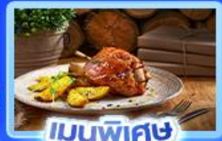
เมนูพิเศษ ขาหมูเยอรมัน