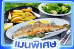
เมนูพิเศษ ปลาเทราต์ย่าง

อัลส์สติกก์ เวียนนา อินส์บรุค ปราสาทนอยชวานส์ไตน์ ลูเซิร์น ริก