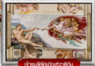
เข้าชมพิพิธภัณฑ์ทิวาติกัน

เมนูพิเศษ! สปาเกตตีเส้นหมึกดำ, พิชซ่าสไตล์อิตาลีแสนแท้