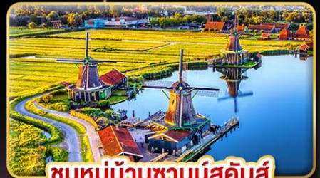
ชมหมู่บ้านชานส์คินส์