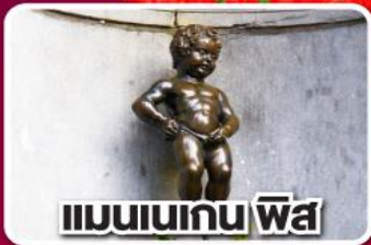
แมนเนเกน ฟิส