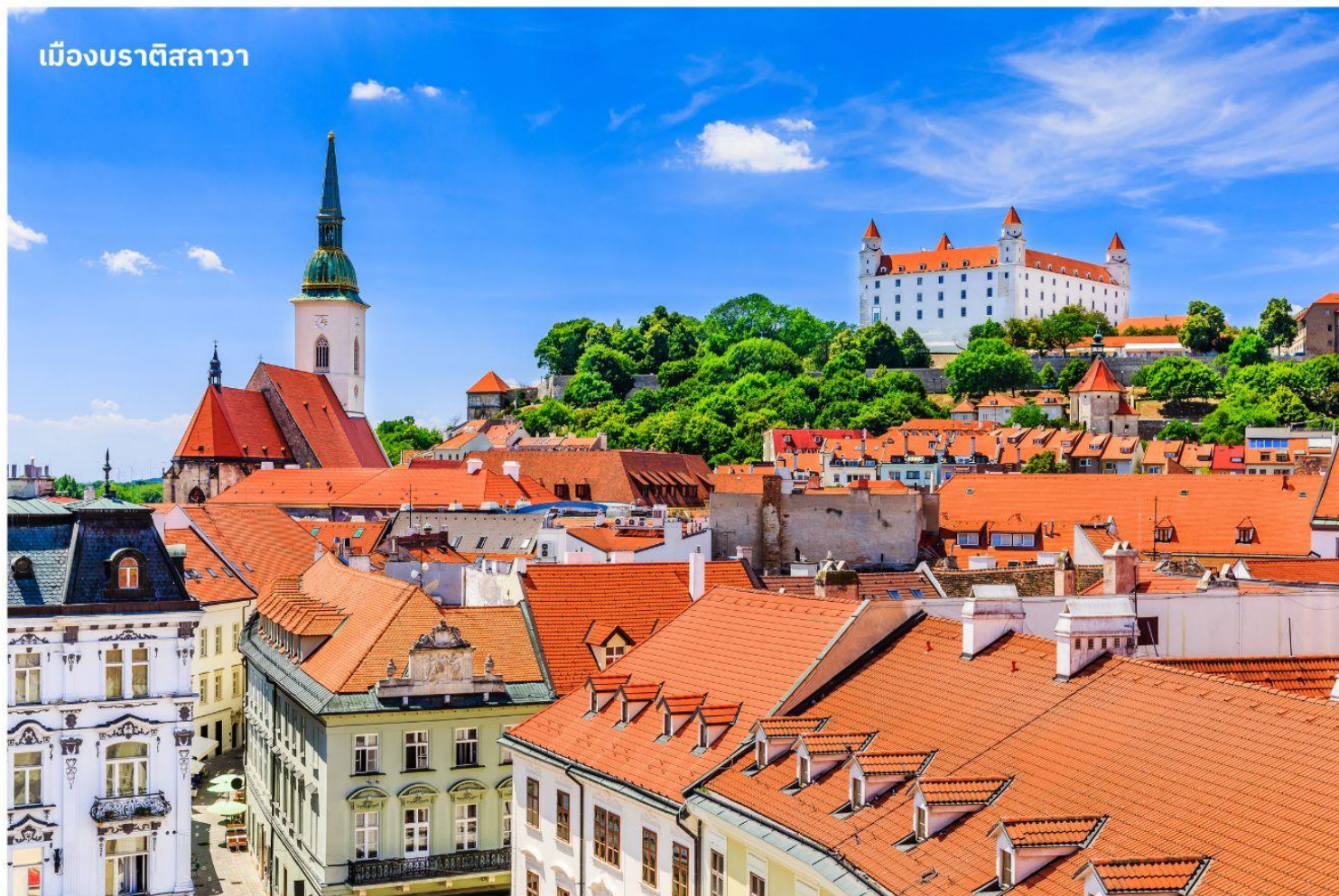
เมืองบราติสลาวา

จากนั้นนำท่านเดินทางสู่ เมืองบราติสลาวา ประเทศสโลวาเกีย ใช้เวลาเดินทางประมาณ 3 ชั่วโมง หรือมีชื่อเรียกอย่างเป็นทางการคือ สาธารณรัฐสโลวัก เป็นประเทศขนาดเล็กที่เพิ่งเข้าร่วมเป็นสมาชิกใหม่ของสหภาพยุโรป เป็นประเทศไม่มีทางออกสู่ทะเล แต่เมืองหลวงแห่งนี้เป็นเมืองที่มีชีวิตชีวาและยังเต็มไปด้วยวัฒนธรรมเก่าแก่ จากนั้นนำท่านถ่ายรูป ปราสาทบราติสลาวา ปราสาทเก่าแก่ที่ตั้งอยู่เหนือแม่น้ำดานูบ เมื่อขึ้นไปบนจุดที่ตั้งของปราสาทจะมองเห็นวิวทิวทัศน์เมืองสโลวาเกียได้ทั่วทั้งเมือง จากนั้นนำท่านเดินทางสู่ ย่านเมืองเก่าบราติสลาวา เป็นที่ตั้งของ ประตูมิคาเอล (Michael's Gate) เป็นประตูและป้อมปราการของเมืองเพียงแห่งเดียวที่ยังคงถูกเก็บรักษาไว้ตั้งแต่สมัยศตวรรษที่ 14