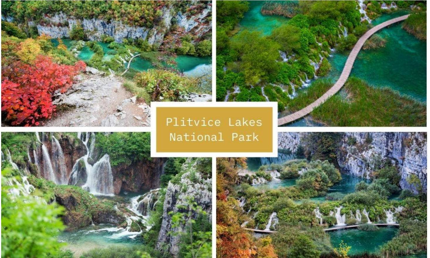
Plitvice Lakes National Park

น้ำตกแห่งนี้ จากนั้นนำท่าน ล่องเรือเพื่อชมวิวสวยๆ ของทะเลสาบ Jezero Kozjak ทะเลสาบที่มีขนาดใหญ่ที่สุดในอุทยานพลิทวิเซ่