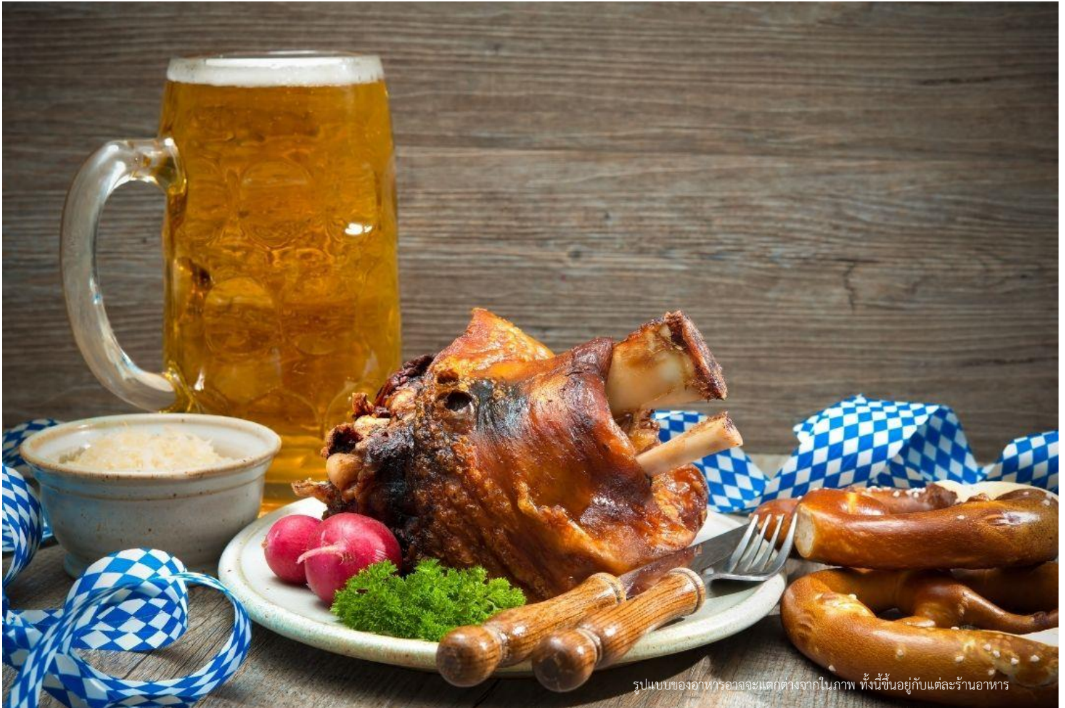
รูปแบบของอาหารอาจจะแตกต่างจากในภาพ ทั้งนี้ขึ้นอยู่กับแต่ละร้านอาหาร

จากนั้นนำท่านเข้าสู่ที่พัก 🏠 Mer cure Hotel Muenchen Sued Messe หรือ เทียบเท่า