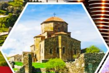
วิหารจอร์