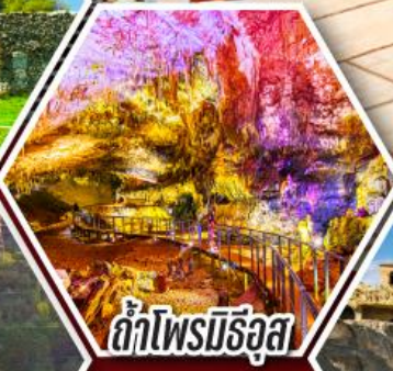
ด้าไฟรมีริอุส