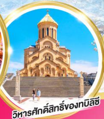
วิหารศักดิ์สิทธิ์ของทбилиซี