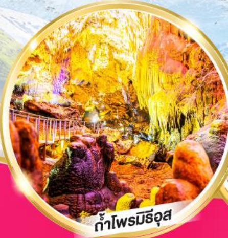
ถ้ำโพรมีธูส