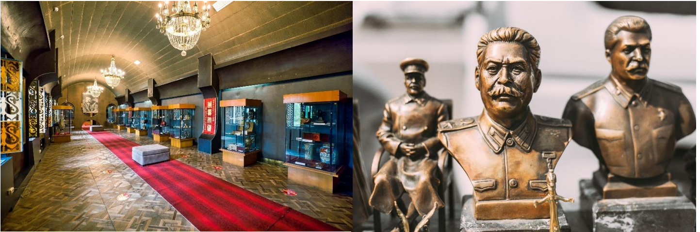
ลินิน ตั้งแต่สถานที่เกิดจนกระทั่งเสียชีวิต

นำท่านชม พิพิธภัณฑสถานลินิน (MUSEUM OF STALIN) ที่ได้รวบรวมเรื่องราวและสิ่งของเครื่องใช้ของท่านสตา