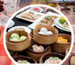
เมนูติ่มซ่า