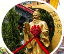
ผูกถ่ายแดง วิกตอเรีย