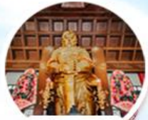
วิกตอเรีย