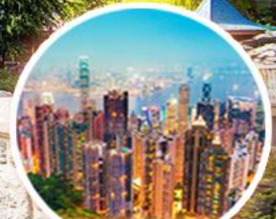
จุดชมวิวก วิกตอเรียพีค