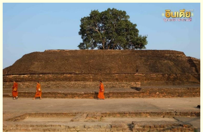
อินเดีย พิเศษพิเศษ

จากนั้น เดินทางสู่ หมู่บ้านนางสุชาดา (Sujata Village) มีลักษณะเป็นกองอิฐเนินสูง ซึ่งนางสุชาดาเป็นผู้ที่ถวายข้าวมธุปายาสให้กับพระพุทธรูปก่อนตรัสรู้ระหว่างทางก็จะผ่าน ชมแม่น้ำเนรัญชรา (Niranjana River) ปัจจุบัน