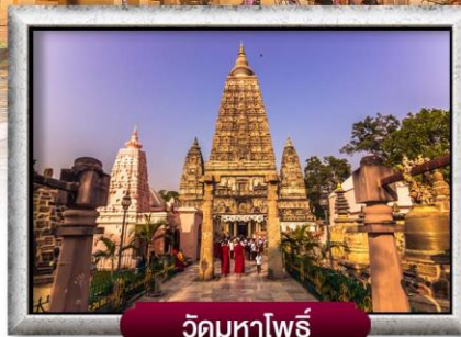
วัดมหาโพธิ์