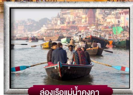
ล่องเรือแม่น้ำคงคา