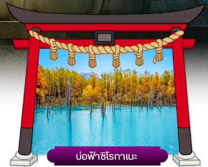
บ่อฟ้าชิโรคาเนะ