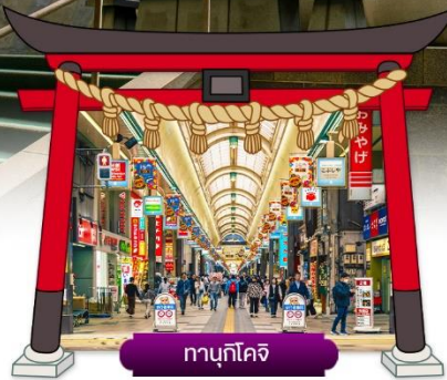
ทานุกิโคจิ