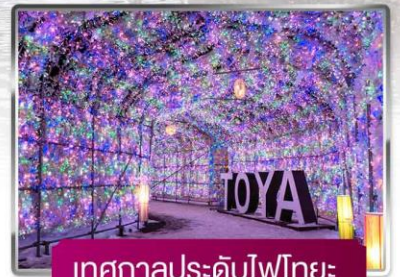
เทศกาลประดับไฟไทยะ