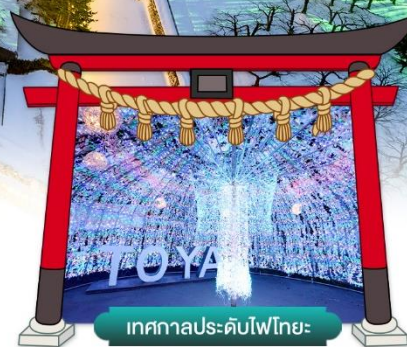
เทศกาลประดับไฟไทยะ