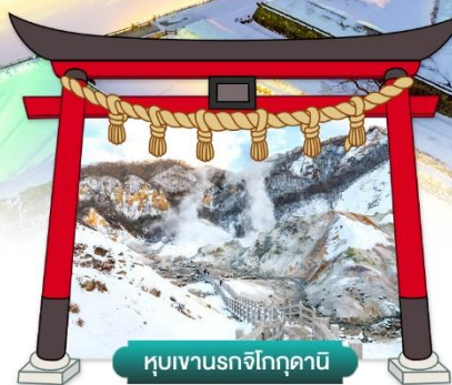
หุบเขานรกจิโกกุคานิ