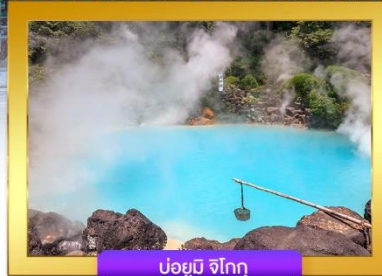
บ่อยูมิ จิโกกุ