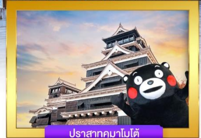
ปราสาทคามาโมโด้