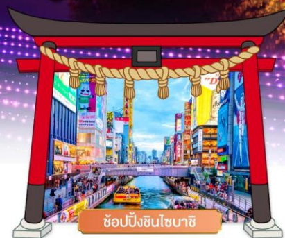
ช้อปปิ้งชินไซบาชิ

เดินทางโดยสายการบิน : ไทยแอร์เอเชียเอ็กซ์