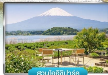
สวนโออิชิพาร์ค