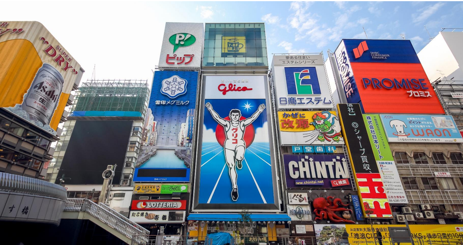
ระลึกตามอัธยาศัย

นำท่านเปิดประสบการณ์ใหม่กับ พิธีชงชาญี่ปุ่น ซึ่งเป็นเอกลักษณ์ของประเทศญี่ปุ่นว่าด้วยการใช้เวลาอย่างสุนทรีย์ ด้วยการตีและการชงชาผงสีเขียวหรือมัทฉะ นับตั้งแต่ประมาณศตวรรษที่ 14 ต้นฉบับของพิธีชงชา และให้ท่านได้สัมผัสกับบรรยากาศของการจำลองเรื่องราวเกี่ยวกับการพบปะกันในวงสังคมเกี่ยวกับการตีและชงชาที่ได้แพร่หลายในบรรดาชนชั้นสูงในประเทศญี่ปุ่น จากนั้นอิสระให้ท่านได้เลือกซื้อของที่