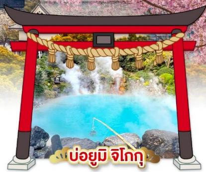
บ่อยูมิ จิโกกุ