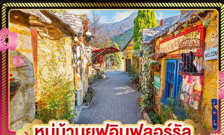
หมู่บ้านยูฟุอินฟลอริล