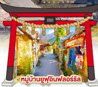
หมู่บ้านยูฟูอินฟลอรัล