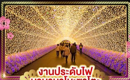
งานประดับไฟ นาบานาโนะซาโตะ