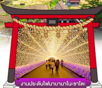
งานประดับไฟนาบานาโนะซาโตะ