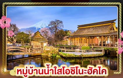
หมู่บ้านน้ำใสโอชิโนะฮักโค