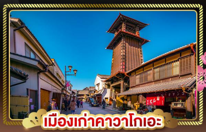
เมืองเก่าคาวาโกเอะ