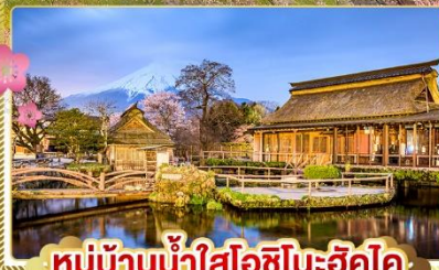
หมู่บ้านน้ำใสโอชิโนะฮัคไค

✓ สักการะพระใหญ่อุซึคุโอบุตสึ ท่ามกลางชากุระ