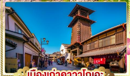
เมืองเก่าคาวาโกเอะ