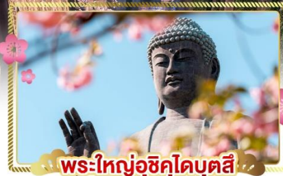
พระใหญ่อุซึคุโดบุตสึ