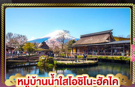
หมู่บ้านน้ำใสโอชิโนะฮักโค