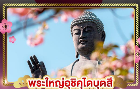
พระใหญ่อุซึคุโดบุตสึ