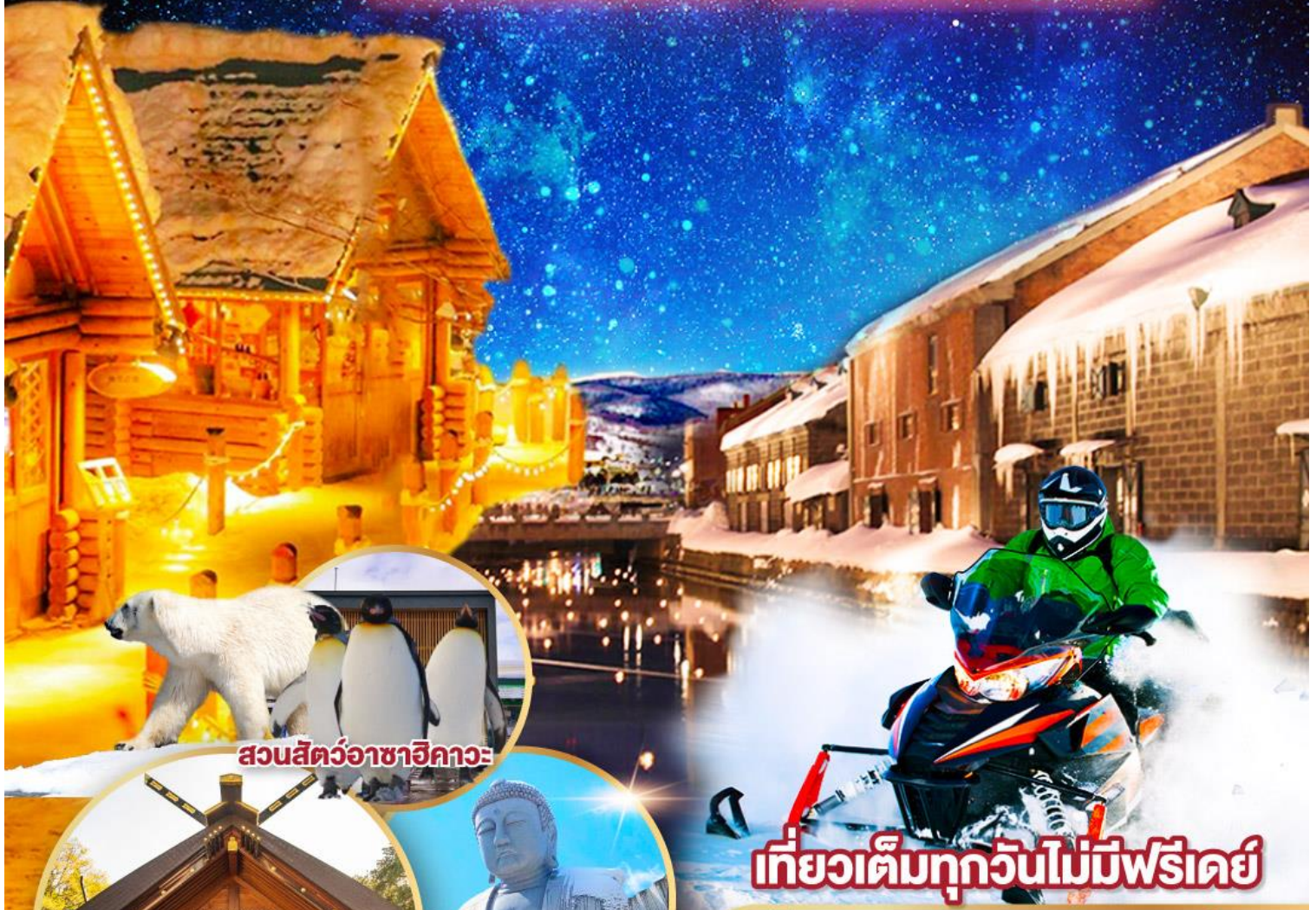
สวนสัตว์อาซาฮิกาวะ

พักโรงแรมในชิปปาโร 2 คืน เต็มอิ่มกับกิจกรรมลานสกี