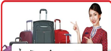
น้ำหนักกระเป๋าสูงสุด 20 กก.