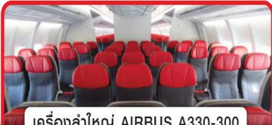
เครื่องลำใหญ่ AIRBUS A330-300 392 ที่นั่ง

สายการบิน THAI LION AIR ใช้เครื่อง AIRBUS A330-300 จำนวน 392 ที่นั่ง เครื่องใหม่ ลำใหญ่ มีจอทีวี การบริการทุกที่นั่ง จัดที่นั่งแบบ 3-3-3 มีบริการอาหารว่างเสิร์ฟทั้งขาไปและขากลับ (น้ำหนักกระเป๋า 20 กก./ท่าน หากต้องการชื้อน้ำหนักเพิ่ม ต้องเสียค่าใช้จ่าย)