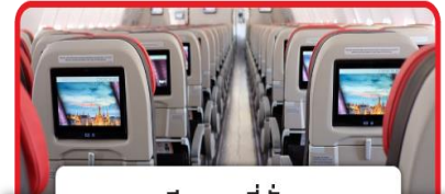
มีจอทุกที่นั่ง