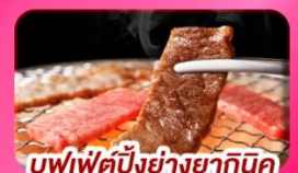
บุฟเฟ่ต์ปิ้งย่างยากินิกุ