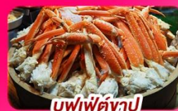
บุฟเฟ่ต์งาปู