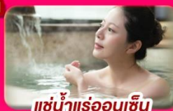
แช่น้ำแร่ร้อนเซ็น