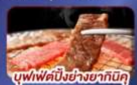
บุฟเฟ่ต์บิงย่างซากุทมิคุ