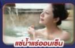
แช่น้ำแร่ร้อนเซ็น