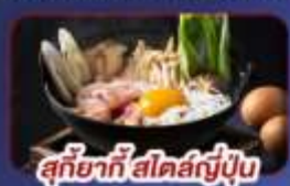
สุกียากี้ สไตส์ญี่ปุ่น