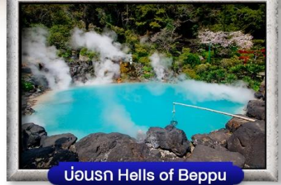
บ่อน้ำ Hells of Beppu

พิเศษ! บุฟเฟ่ต์ยากินิคุ, สุกียากี้ สไตลญี่ปุ่น