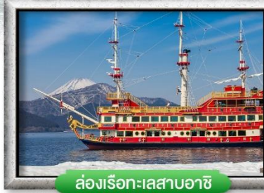
ล่องเรือทะเลสาบอาชิ