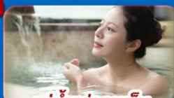
แช่น้ำแร่ร้อนเซ็น