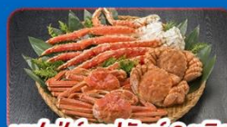
บุฟเฟ่ต์ซาปูยิกซ์ 3 ชนิด