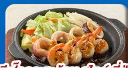
ชิฟุคเกอร์ร้อน สลัดญี่ปุ่น

มหัศจรรย์...JAPAN ไทยะโกะ อาซาฮิกาว่า ชิปปโปโร