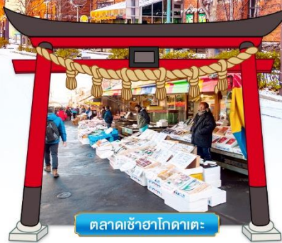
ตลาดเช้าฮาโกดาเตะ