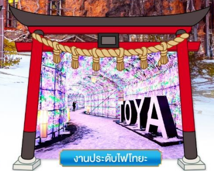
งานประดับไฟโทยะ

พิเศษ! บุฟเฟ่ต์จางูยักษ์ 3 ชนิด, แช่น้ำแร่ออนเซน