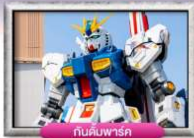
กันดั้มพาร์ค