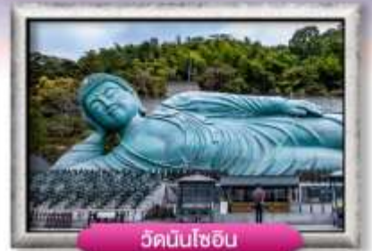
วัดนินโซอิน