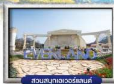
สวนสนุกเอเวอร์แลนด์