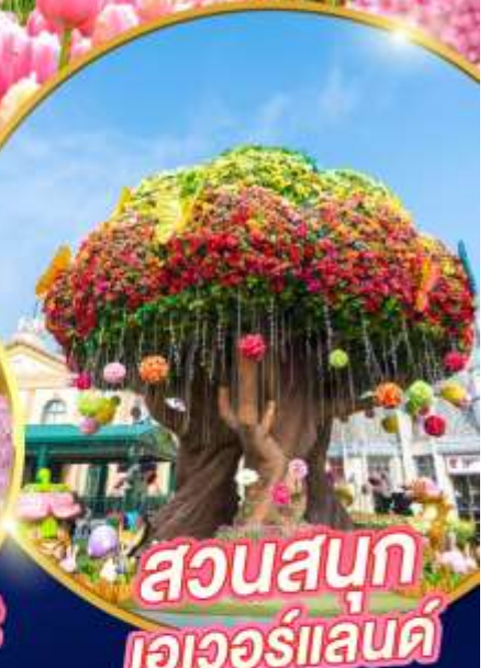
สวนสนุก เอเวอร์แลนด์