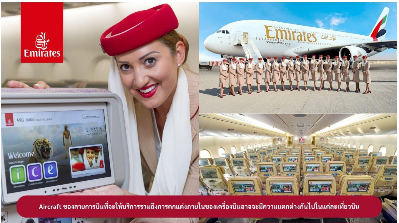
Aircraft ของสายการบินที่จะให้บริการรวมถึงการตกแต่งภายในของเครื่องบินอาจมีความแตกต่างกันไปในแต่ละเที่ยวบิน

23.00 น. !!!! ขณะเดินทางพร้อมกัน ณ สนามบินสุวรรณภูมิ อาคารผู้โดยสารขาออกระหว่างประเทศ ชั้น 4 ประตู 9 แถว T สายการบินเอมิเรตส์ แอร์ไลน์ (EK) เจ้าหน้าที่ให้การต้อนรับและอำนวยความสะดวก