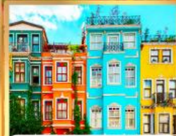
บ้านหลากสี คิลลอร์ฟูลา