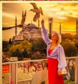
ลูปทอปเซเวนฮิลล์ส