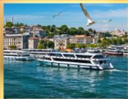
เรือเฟอร์รี่