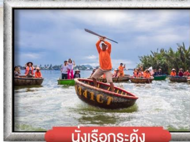
นิงเรือกระด้าง