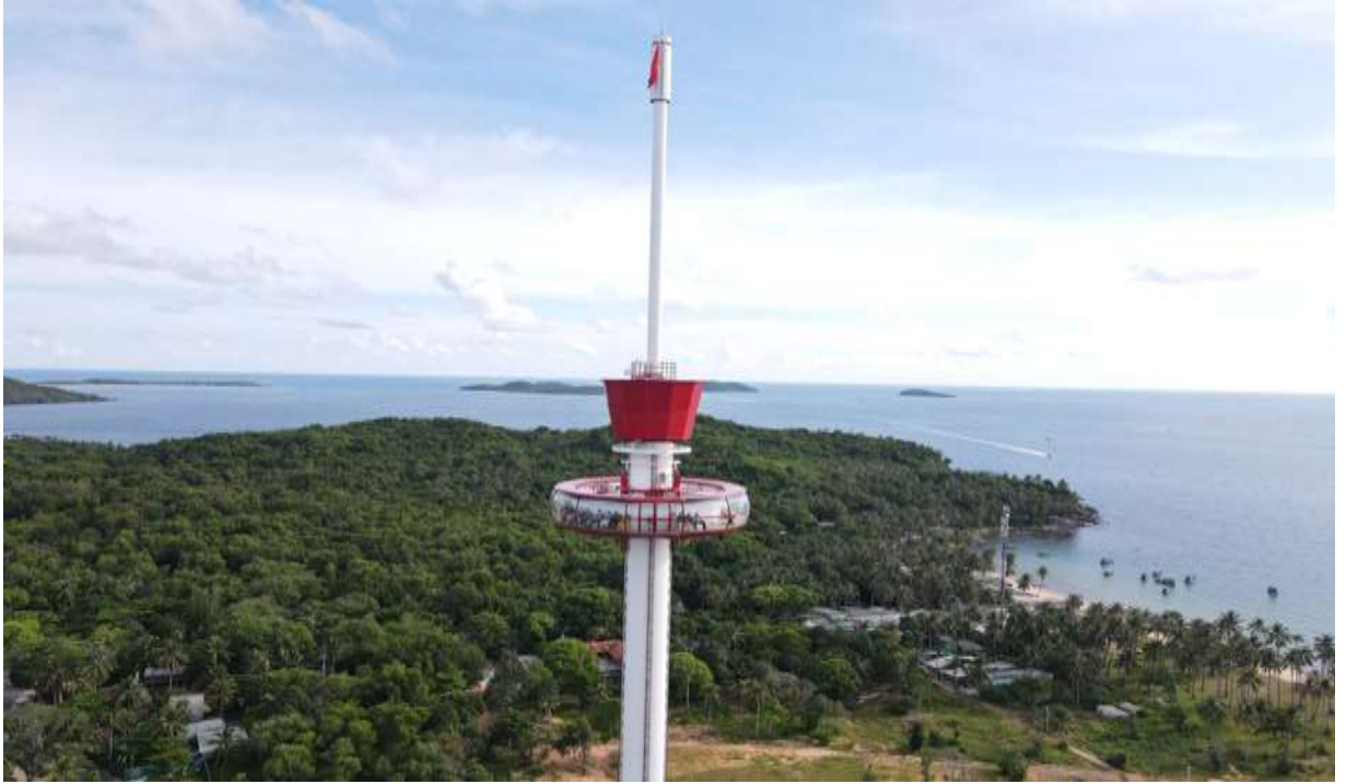
อิสระให้ท่านเดินเล่นที่ชายหาด Hon Thom