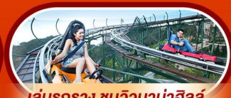
เล่นรถราง ชมวิวบานาฮิลล์