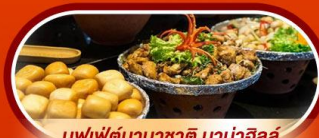
บุฟเฟต์นานาชาติ บานาฮิลล์