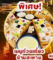
พิเศษ! เมนูถ้วยเดี่ยว ข้ามสะพาน