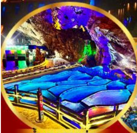
ด่านกนงแอง