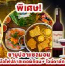
พิเศษ! ชาบูปลาหมอน หม้อไฟปลาสดอร่อย + ไวน์ดาด

18,919 ราคา เริ่มต้น รวมภาษีมูลค่าเพิ่ม 7%