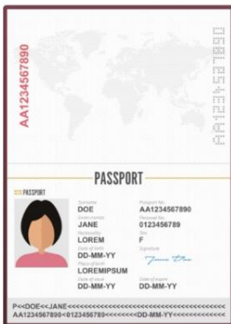
รูปถ่ายหน้าพาสปอร์ต