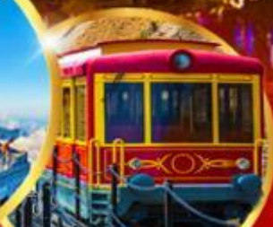
รถรางซาปา