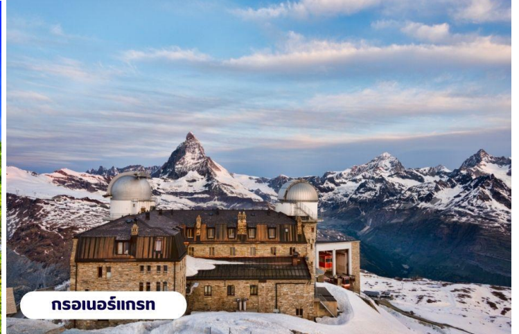
กรอเนอร์กรัท