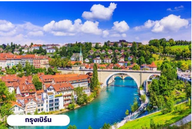
กรุงเบิร์น

☉ บริการอาหารเช้า ณ ห้องอาหารของโรงแรม จากนั้นนำท่านเที่ยวชมสถานที่สำคัญต่างๆในกรุงเบิร์น กรุงเบิร์นได้รับการยกย่องจากองค์การยูเนสโกให้เป็นเมืองมรดกโลก ในปี ค.ศ. 1863 นอกจากนี้เบิร์น ยังถูกจัดอันดับอยู่ใน 1 ใน 10 ของเมืองที่มีคุณภาพชีวิตที่ดีที่สุดในโลกในปี ค.ศ. 2010 นำท่านชม บ่อหมีสีน้ำตาล สัตว์ที่เป็นสัญลักษณ์ของกรุงเบิร์น นำท่านชม มาร์กาสเซ ย่านเมืองเก่า ปัจจุบันเต็มไปด้วยร้านดอกไม้และบูติก เป็นย่านที่ปลอดภัย จึงเหมาะกับการเดินเที่ยวชมอาคารเก่า อายุ 200-300 ปี นำท่านลัดเลาะชม ถนนจุงเคอร์นกาสเซ ถนนที่มีระดับสูงสุดของเมืองนี้ ซึ่งเต็มไปด้วยร้านภาพวาดและร้านขายของเก่าในอาคารโบราณ ชม นาฬิกาใช้ทอล์คเคนทรม์ อายุ 800 ปี ที่มีโชว์ให้ดูทุกๆชั่วโมงในการตีบอกเวลาแต่ละครั้ง หอนาฬิกานี้ ในช่วงปี ค.ศ. 1191-1256 ใช้เป็นประตูเมืองแห่งแรก ภายหลังได้ดัดแปลงใช้ทอล์คเคนทรม์ให้กลายมาเป็นหอนาฬิกา พร้อมติดตั้งนาฬิกาดาราศาสตร์เข้าไป จากนั้นอิสระให้ท่านเดินเล่นและเก็บภาพตามอัยาศัยหรือจะเลือกช้อปปิ้งซื้อสินค้าแบรนด์เนมและซื้อของที่ระลึก